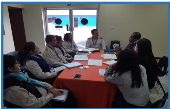
Reunión para Implementación Clasificador Temático 02 - Seguridad

Por último, al concluir la ronda de reuniones se solicitó a las instituciones del Sistema Nacional de Seguridad que realizaran la solicitud formal de vinculación de estructuras al Clasificador Temático 02- Seguridad para dar cumplimiento a lo establecido en ley.