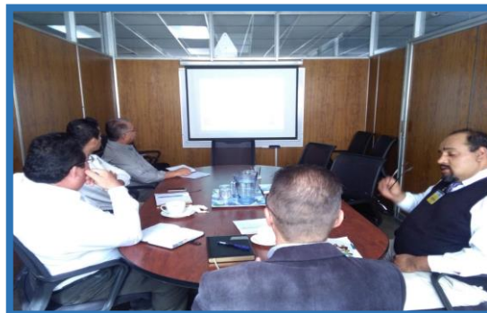
Reunión para Implementación Clasificador Temático 02 - Seguridad