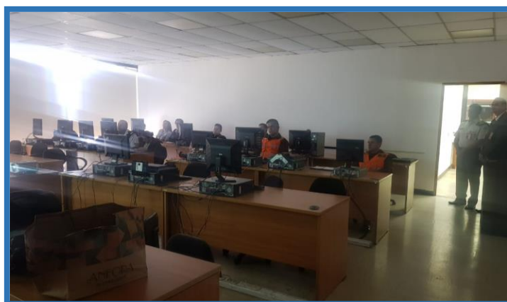
Capacitación sobre el uso del módulo de registro y reportaría para clasificadores temáticos dentro del SICOIN, Ministerio de la Defensa Nacional