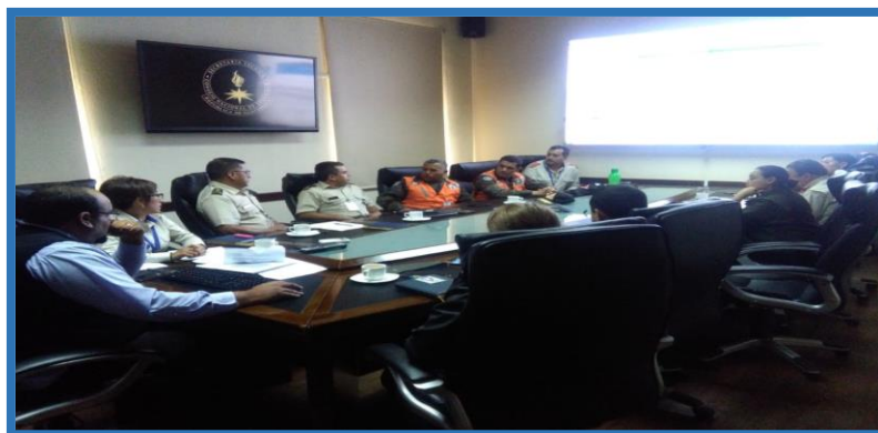
Reunión para Implementación Clasificador Temático 02 - Seguridad