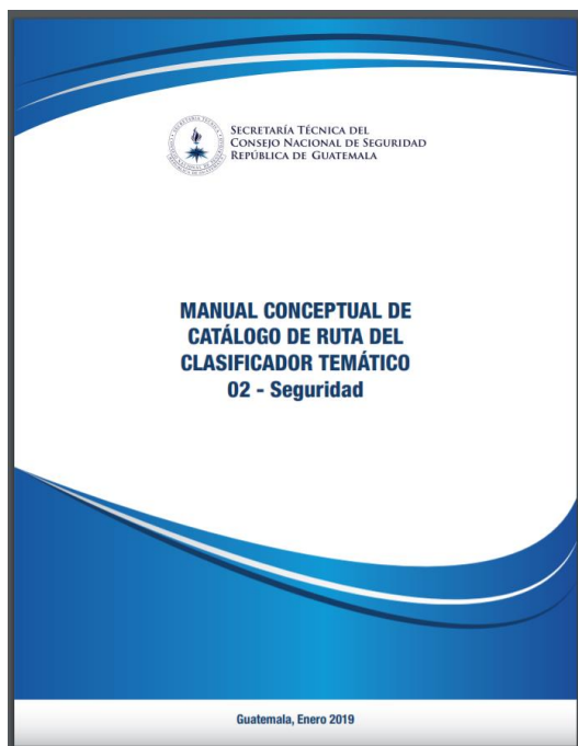
Ilustración 1. Manual Conceptual de Catálogo de Ruta del Clasificador Temático Presupuestal 02- Seguridad.

A inicios de febrero de 2019, en cumplimiento del Artículo 18 del Decreto 25-2018, Ley del Presupuesto General de Ingresos y Egresos del Estado para el Ejercicio Fiscal 2019, la Secretaría Técnica del Consejo Nacional de Seguridad, publicó en su portal web, el Manual Conceptual de Catálogo de Ruta del Clasificador Temático 02- Seguridad para el ejercicio fiscal 2019 (Ilustración 1).