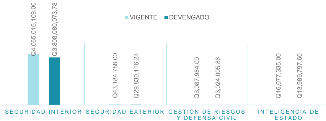
Gráfico 2. Presupuesto Vigente y Devengado por Componente del CT02- S