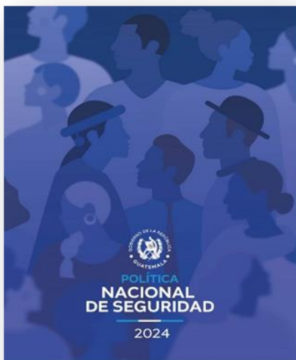
Portada de la Política Nacional de Seguridad 2024.

Finalmente, el proceso se llevará a cabo por etapas en acompañamiento del Ministerio de Finanzas Públicas la cual da inicio con el ajuste del Manual Conceptual, prosiguiendo con las gestiones para el marcaje institucional y finalmente con la capacitación de las instituciones para cargar la información que se reportará periódicamente.