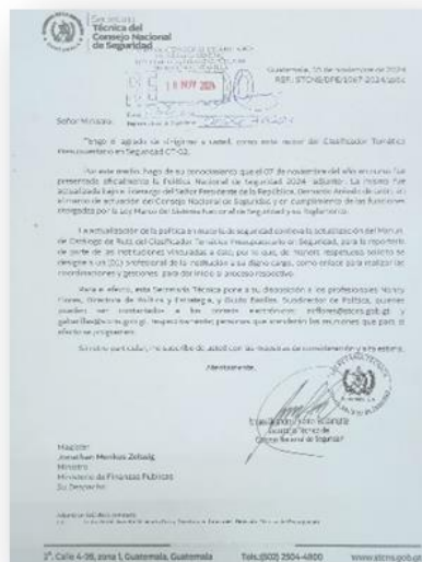
Oficio de solicitud a MINFIN de actualización del Clasificador Temático 02 Seguridad.